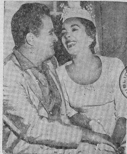
Lo que parece ser otra discusión entre el productor Mike Todd y su esposa la actriz Liz Taylor no es más que una parodia para los fotógrafos de sus verdaderas trifulcas en Londres y París. Todd dijo que busca casa cerca de Nueva York donde esperarán la llegada de su primer hijo.