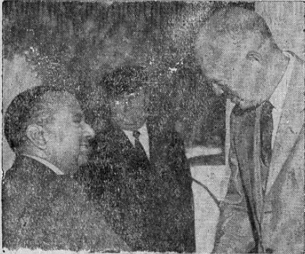
James M. Langley, embajador designado en Pakistán, es recibido por el Presidente Eisenhower al llegar a la Casa Blanca para saludar al Presidente.